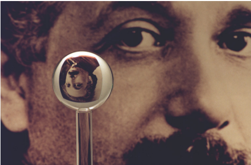
Abb. 3: Diese nahezu perfekte Kugel wird im Gravity Probe B Satellitenexperiment eingesetzt um die Krümmung der Raumzeit nahe der Erde zu überprüfen, wie sie von der allgemeinen Relativitätstheorie vorhergesagt wird.

Die in den folgenden Jahren vorangetriebene Institutionalisierung dieser Gemeinschaft – mit regelmäßigen Konferenzen, spezialisierten Zeitschriften und einem regen Austausch junger Wissenschaftler zwischen den weit verstreuten Zentren dieser Forschung – geschah zum Teil nach dem Vorbild etablierter Unterdisziplinen der Physik, wie der Kernphysik. Aber, im Vergleich zu den Kernphysikern, musste sich diese Gemeinschaft, die „General Relativity and Gravitation Community,“ in viel