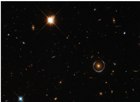
Abb. 1: Das Bild einer fernen Galaxis wird zu einem sogenannten Einstein-Ring verzerrt, aufgrund des Gravitationslinsen-Effekts, den Einstein auf Grundlage seiner allgemeinen Relativitätstheorie vorhergesagt hatte.

In den 1960er- und 1970er-Jahren rückte die allgemeine Relativitätstheorie zurück in den Fokus der Aufmerksamkeit. Forscher, die sich