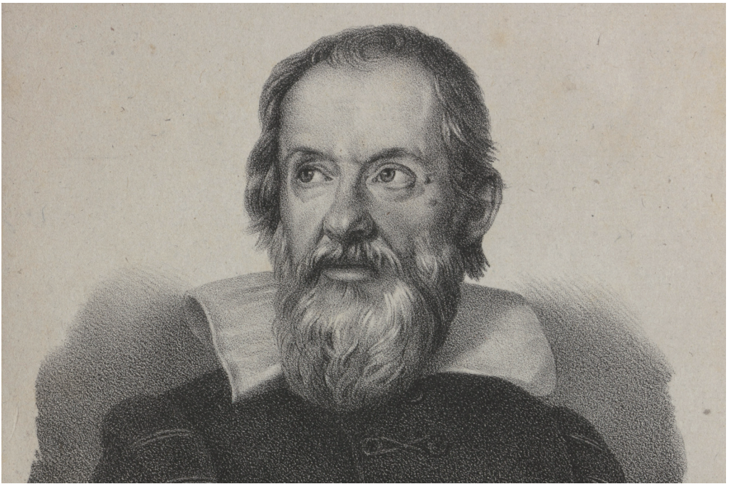
Galileo Galilei: Opere complete . Vol. 1. Firenze, 1842. Bibliothek des Max-Planck-Instituts für Wissenschaftsgeschichte.

staben sind Dreiecke, Kreise und andere geometrische Figuren, ohne die es dem Menschen unmöglich ist, auch nur ein Wort zu verstehen; ohne sie ist es ein vergebliches Herumirren in einem dunklen Labyrinth“. Mit den Discorsi , die Galilei in hohem Alter ohne das vorherige kopernikanisches Pathos schreibt, gelingt ihm eine wegweisende Demonstration der mathematischen Beschreibbarkeit der Natur. In dem Werk spricht der Mathematiker aber auch den Technikern des Arsenalen seinen Dank aus. Im Arsenal, der venezianischen Flottenbasis und Werft, wo Fragestellungen des Schiffbaus, des Wasserbaus und der Artillerie zusammenflie-